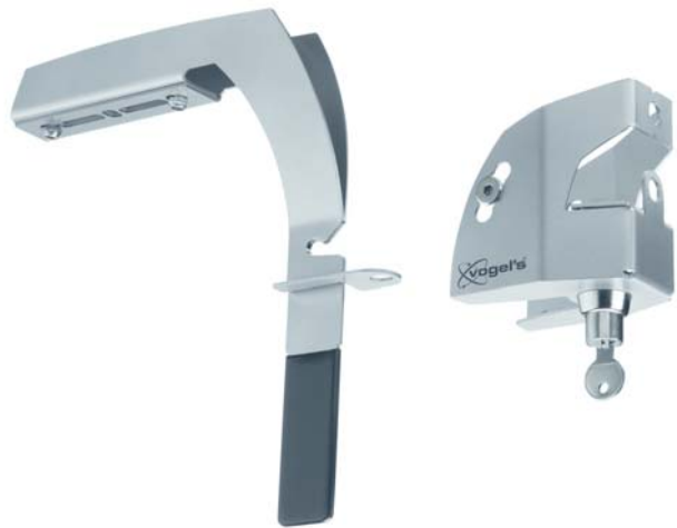
Wandschloss PPSA 100