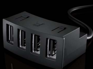
TwistDock USB HUB